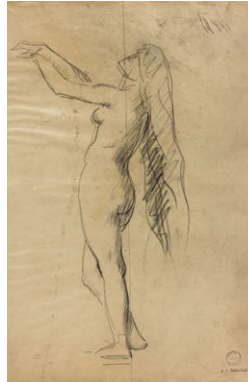
Andromède , vers 1880 Fusain sur papier transparent Donation Marie Henner, JJHD 99