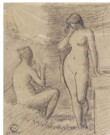
Idylle , vers 1872 Fusain sur papier transparent Donation Marie Henner, JJHP 158