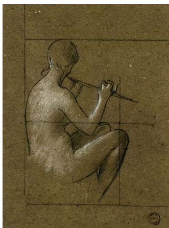
Flûtiste assise , 1872 Carré Conté et craie blanche sur papier vélin Donation Marie Henner, JJHD 155