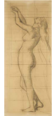
Andromède , vers 1880 Fusain sur papier marouflé sur toile Donation Marie Henner, JJHD 100