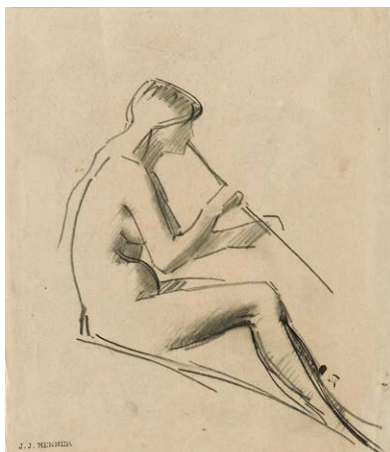
Flûtiste pour Églogue , 1879 Carré Conté sur papier vélin Donation Marie Henner, JJHD 143