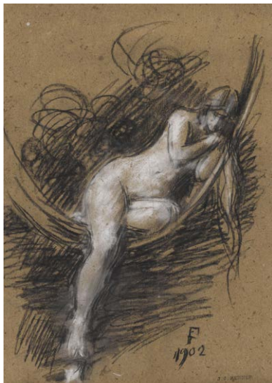
Sara la baigneuse , 1902 Carré Conté et craie blanche sur papier Donation Marie Henner, JJHD 171

«Sara, belle d'indolence, Se balance Dans un hamac, au-dessus Du bassin d'une fontaine Toute pleine D'eau puisée à l'Ilyssus.»