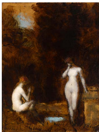
Idylle , vers 1872 Huile sur carton Donation Marie Henner, JJHP 256