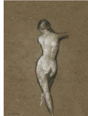
La Fée aux roches , vers 1882 Carré Conté et craie blanche sur papier vélin Donation Marie Henner, JJHD 160