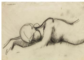
Byblis , vers 1867 ? Carré Conté sur papier transparent Donation Marie Henner, JJHD 498

«Elle avait déjà passé le mont Cragus, la ville de Lymire, les ondes du Xanthe, et la montagne où la Chimère, au milieu des feux, montre la tête, la poitrine d'un lion, et la queue d'un serpent; muette et couchée sur la terre, elle arrache avec ses ongles les herbes vertes, et mouille le gazon d'un ruisseau de larmes.»