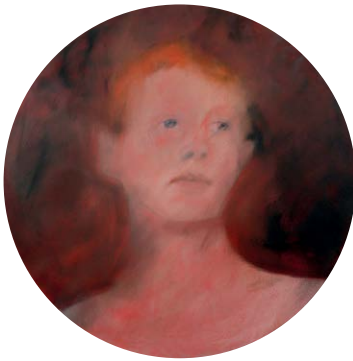
Portrait de garçon aux cheveux roux #2, huile sur toile, 60 cm de diamètre, 2017.