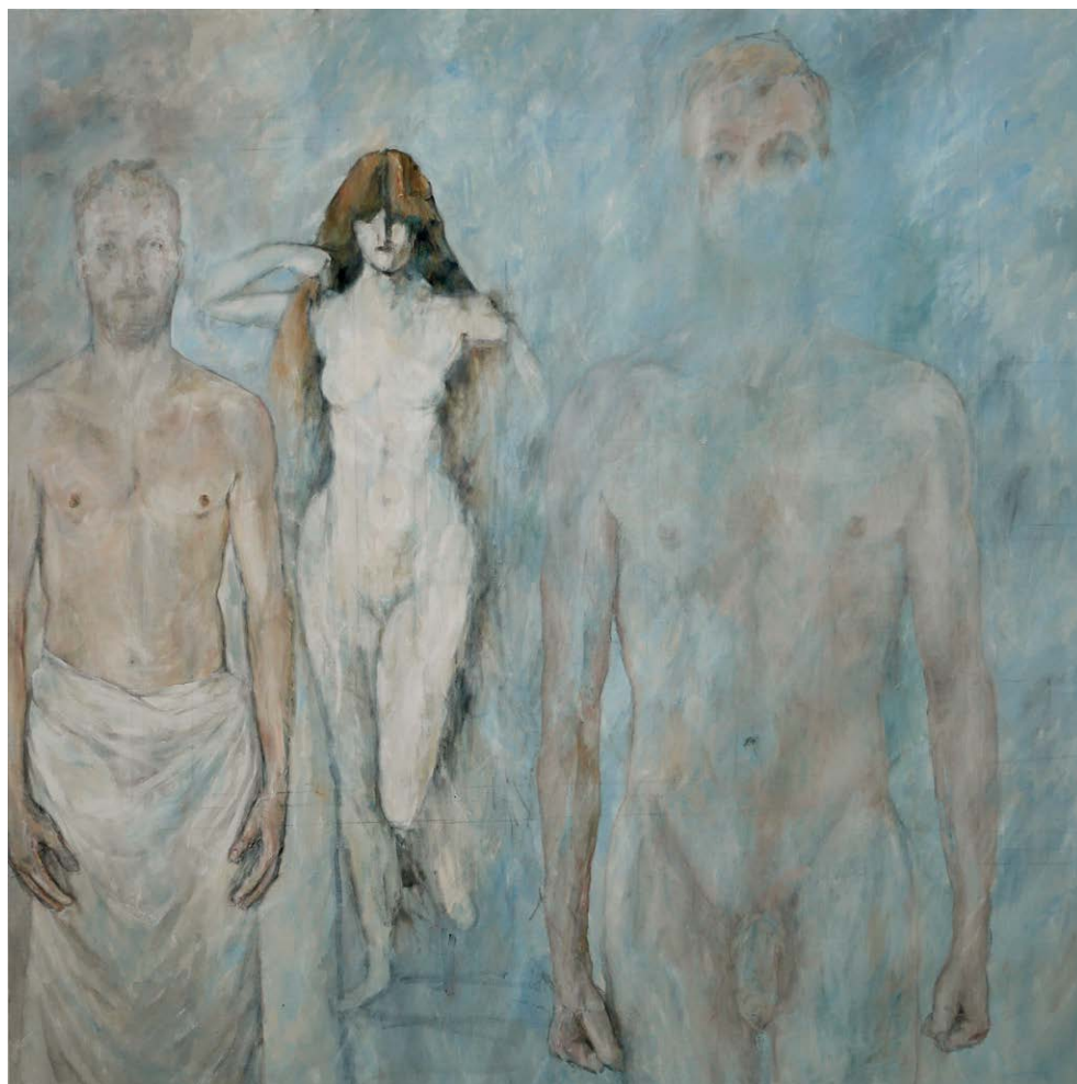
Résonances (La Vérité de Henner), huile sur toile, 130 x 130 cm, 2018.