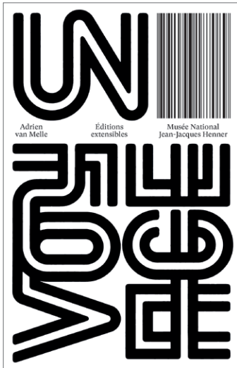
Adrien van Melle, Un Voyage Éditions extensibles