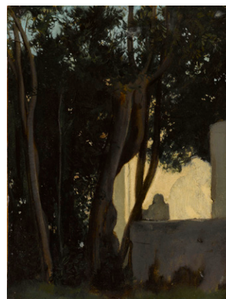
Jean-Jacques Henner, Fontaine dans les lauriers , jardin de la Villa Médicis, 1859